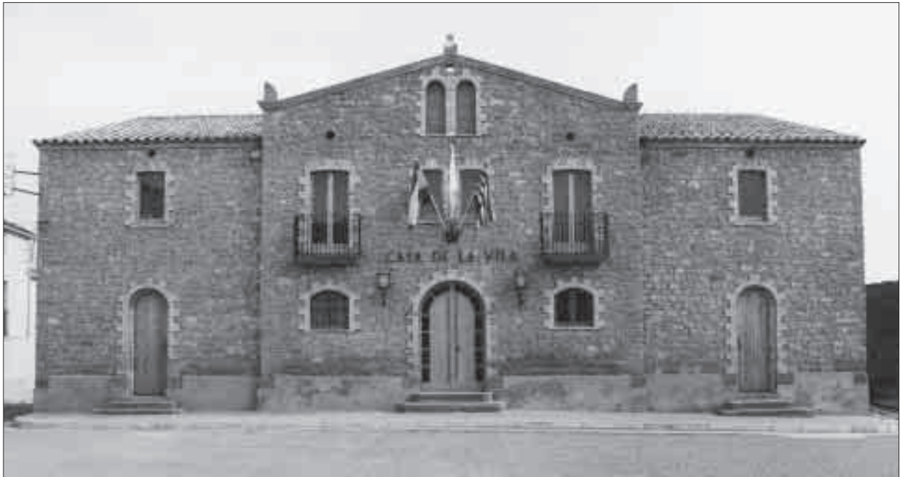
Ajuntament dels Plans de Sió.