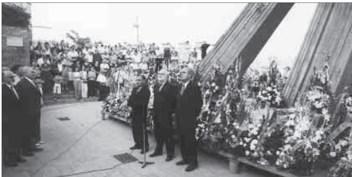
11 de Setembre de 2000. Ofrena floral al Monument de la Generalitat de Cervera.