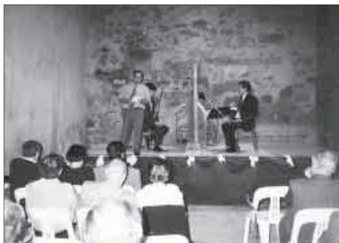
Música als castells.