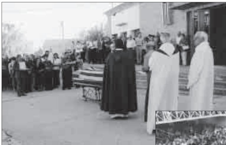
Arribada de la comitiva fúnebre al local social de les Pallargues.