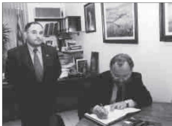
Visites institucionals als Plans de Sió.