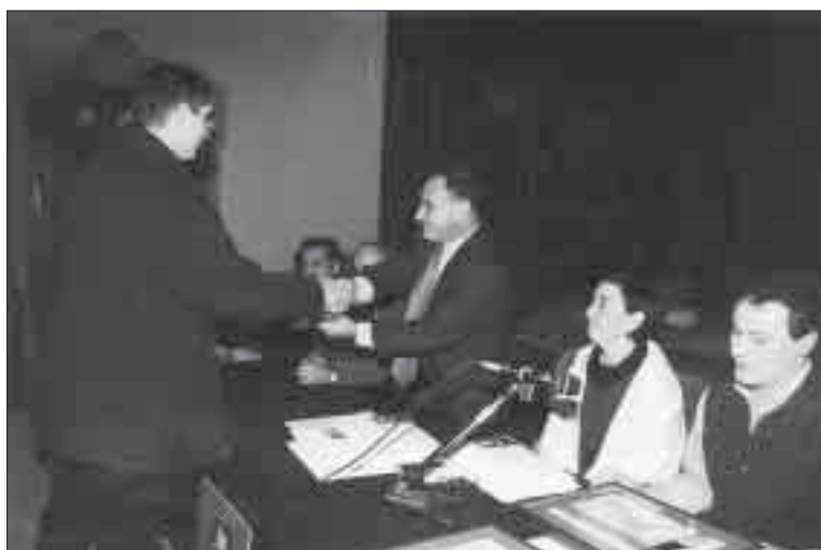
Lliurant premis als artesans de la Segarra.