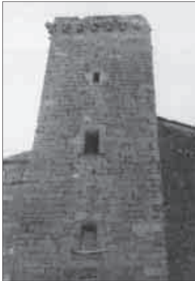
Torre del castell de l'Aranyó.

D'ell va sortir la iniciativa de tenir un representant per cadascun dels onze pobles, fet que s'ha portat a terme en cada legislatura.