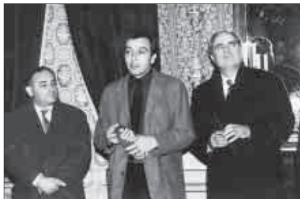
Presentació de la Guia Gastronòmica de la Segarra. Any 2002.