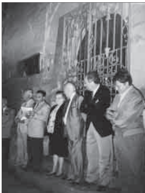
Homenatge a Manuel de Pedrolo, al castell de l'Aranyó.