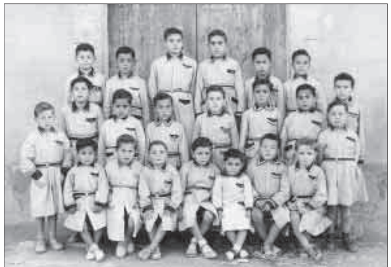
Amb els companys de l'escola de les Pallargues.