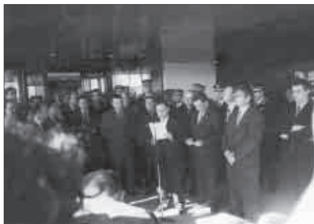
Inaugurant la comissaria dels Mossos d'Esquadra a Cervera.