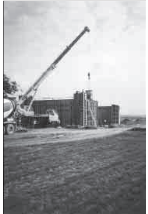
Fotos esquerra i superior: Construcció de la canonada de la Vall del Sió.