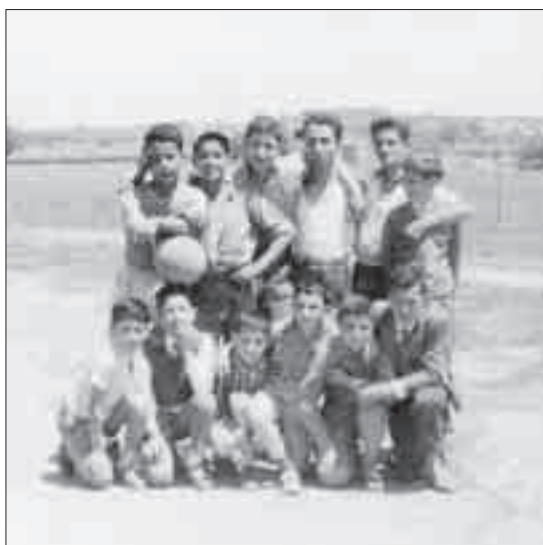
Un dia de lleure i futbol.