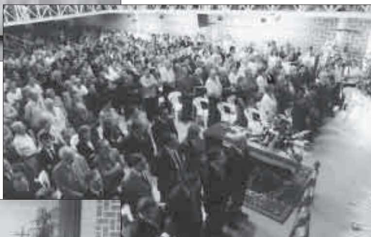
Autoritats i familiars al capdavant del dol.