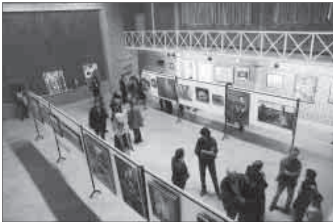
L'exposició dels quadres durant les festes de Nadal.