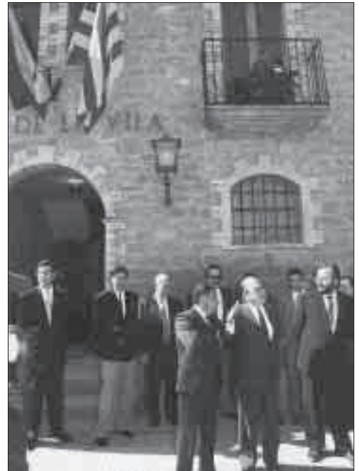
El president Pujol inaugura, als Plans de Sió, la portada d'aigües a la Segarra. Maig de 1993.