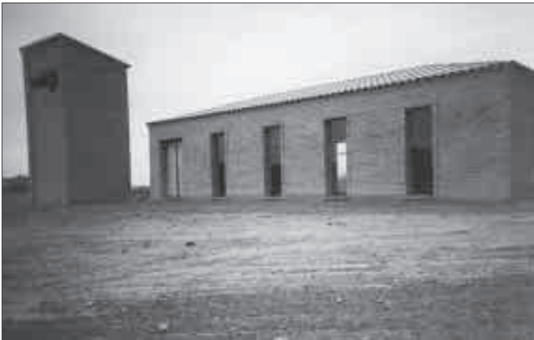
Estació de bombeig de Ratera.