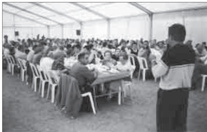
Amb la gent dels nostres pobles.