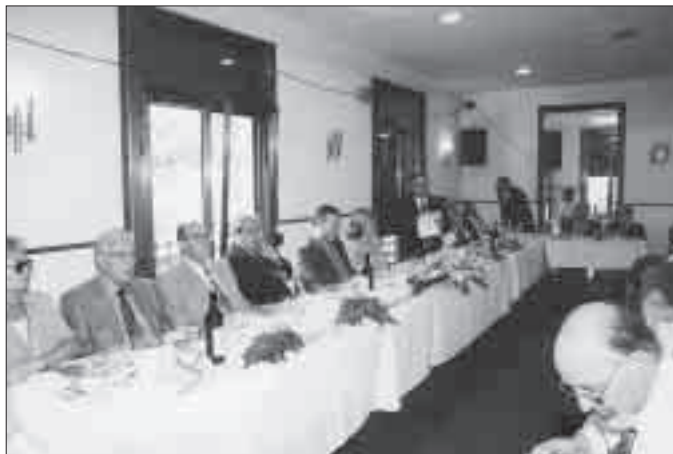
Al Centre Comarcal Lleidatà de Barcelona (2-10-99).