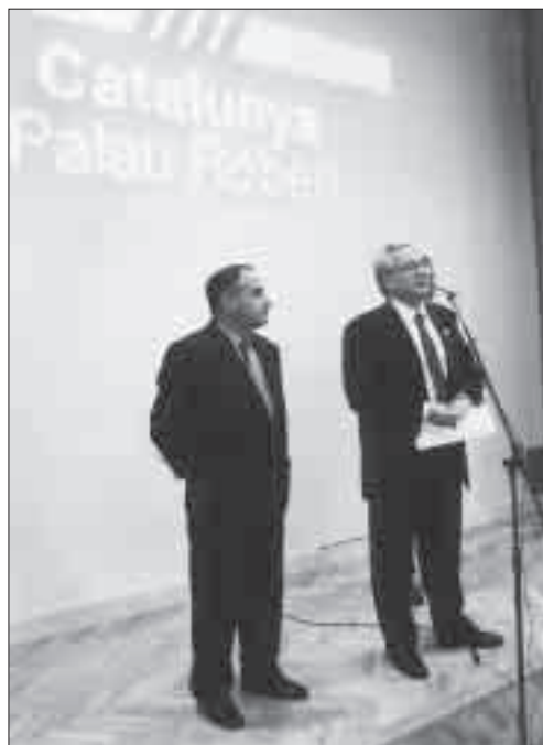
Exposició de la Segarra al Palau Robert (21-9-99).