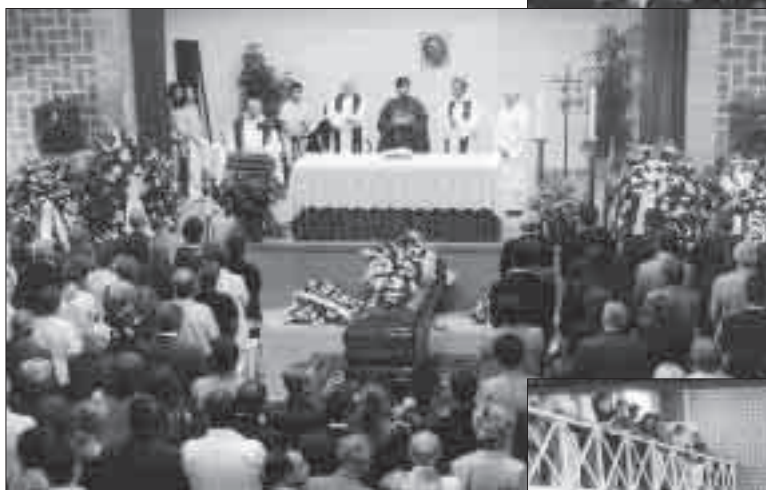
El local social va resultar insuficient per encabir la gernació vinguda d'arreu, per retre l'últim adéu al nostre alcalde.