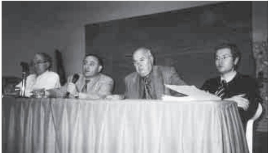
Inici del procés de concentració parcel·laria als Plans de Sió.