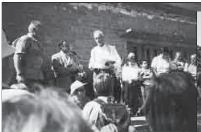
En aquestes dues imatges, junt amb els esportistes.