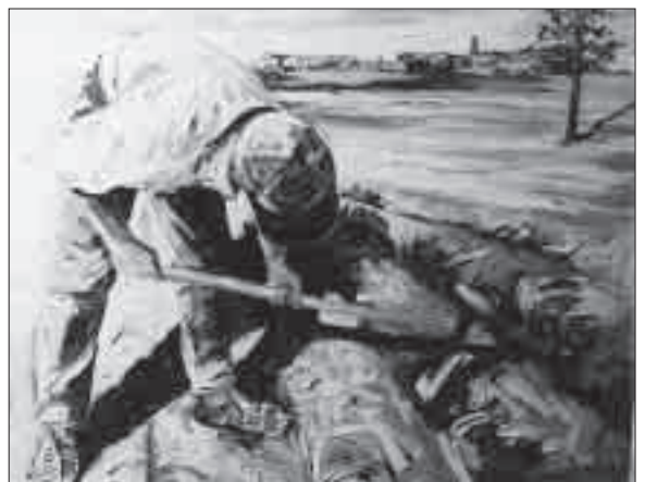
Diferents obres premiades del concurs de pintura “Els Plans de Sió”.