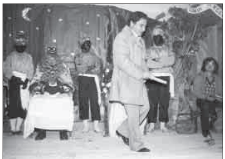
Amb els Reis recollint un regal. Any 1982.