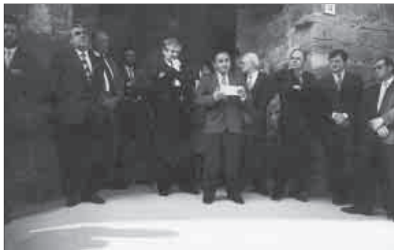
Al castell de les Pallargues.