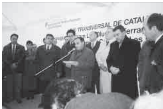
Inaugurant un tram de l'Eix Transversal de Catalunya.