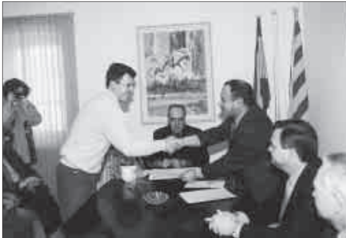
Entregant premis als guanyadors.