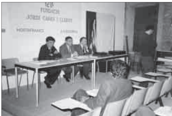
A Hostafrancs, durant una conferència de la Fundació Jordi Cases.