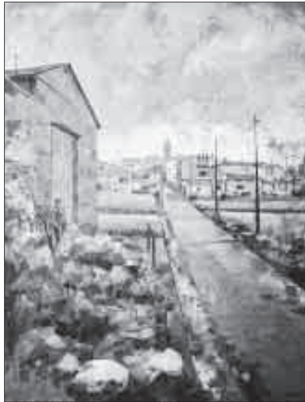
Dues visions del poble de les Pallargues (de quadres procedents del Concurs de Pintura "Els Plans de Sió").

Devies ser conscient de la teva malaltia, del teu possible viatge, però mai no s'esborrà el teu somriure ni la teva contribució al bé comú, ni per un moment flaquejaren els teus ideals.