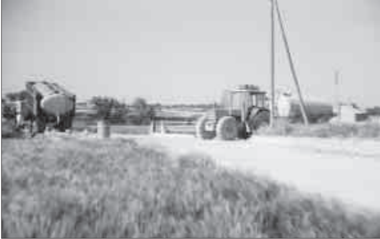
Els pobles abastits per camions cisternes, l'any 1987.