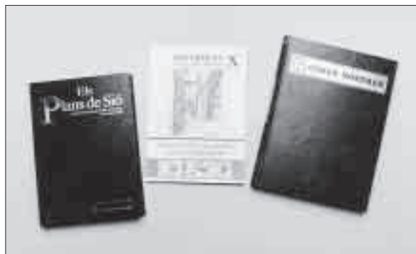
Alguns llibres del seu llegat cultural.